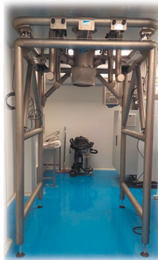
Cierre por globo