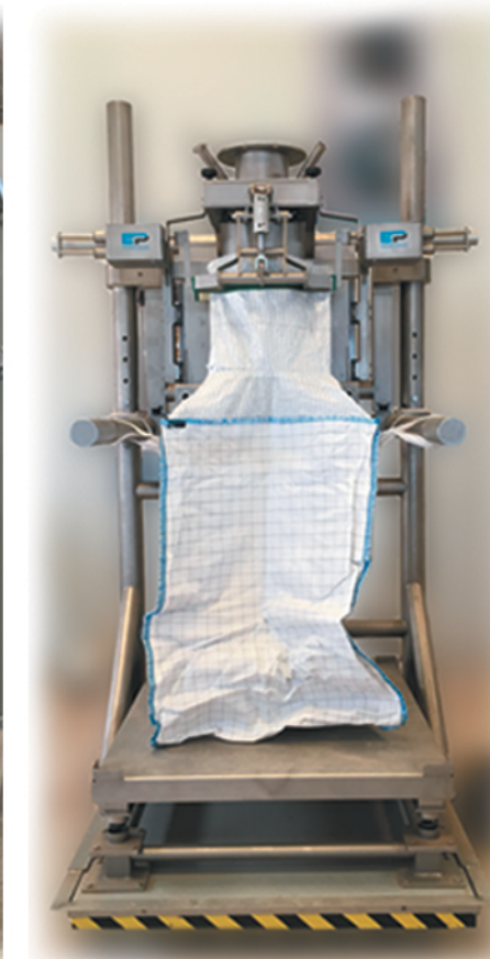
Cierre por pistones