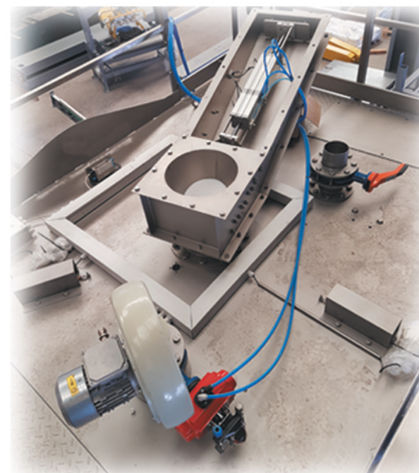
Equipos de dosificación