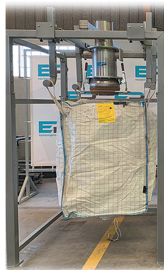
Cierre por palanca